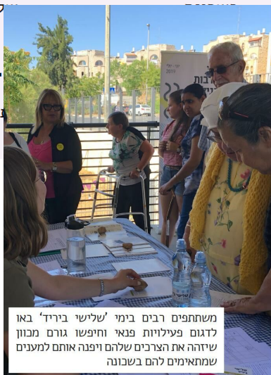
משתתפים רבים בימי 'שלישי ביריד' באו לדגום פעילויות פנאי וחיפשו גורם מכוון שיווה את הצרכים שלהם ויפנה אותם למענים שמתאימים להם בשכונה