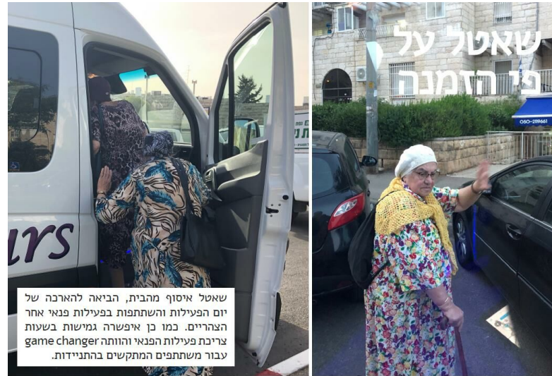
שאטל איסוף מהבית, הביאה להארכה של יום הפעילות והשתתפות בפעילות פנאי אחר הצהריים. כמו כן איפשרה גמישות בשעות צריכת פעילות הפנאי והוותה game changer עבור משתתפים המתקשים בהתניידות.

מבאי שלישי ביריד אינם משתתפים באופן קבוע בפעילויות הפנאי