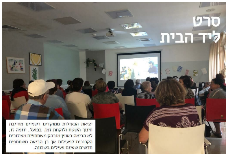
יציאת הפעילות ממוקדים רשמיים מחייבת חינוך השטח ולוקחת זמן. בפועל, יוזמה זו, לא הביאה באופן מובהק משתתפים מאיזורים הקרובים לפעילות אך כן הביאה משתתפים חדשים שאינם פעילים בשכונה.