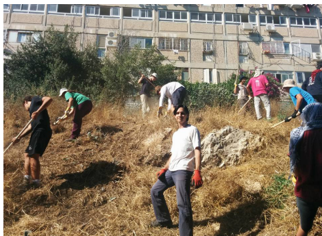
הכנת שטח להקמת יער מאכל