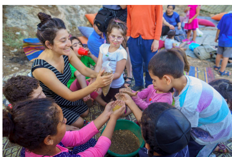
הכנת כדורי זרעים בפעילות קהילתית ביער מאכל בירושלים