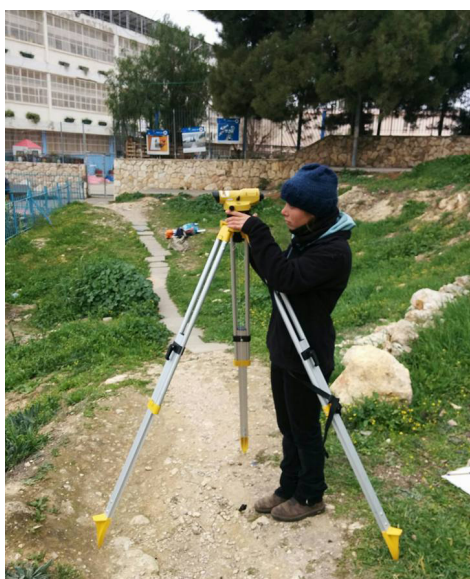
מדידות שטח ביער מאכל