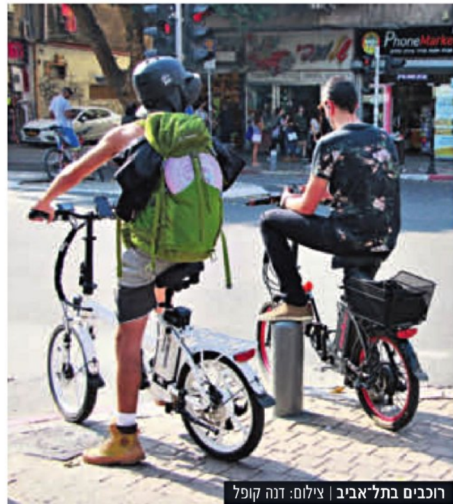
רוכבים בתל-אביב

הוסר המכשול ממתן סמכויות לפקחי העיריות: כוחות הביטחון לא יקבלו חסינות מוחלטת על רכיבה שלא כחוק